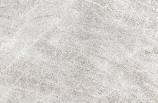
Keramik Taj Mahal Silk