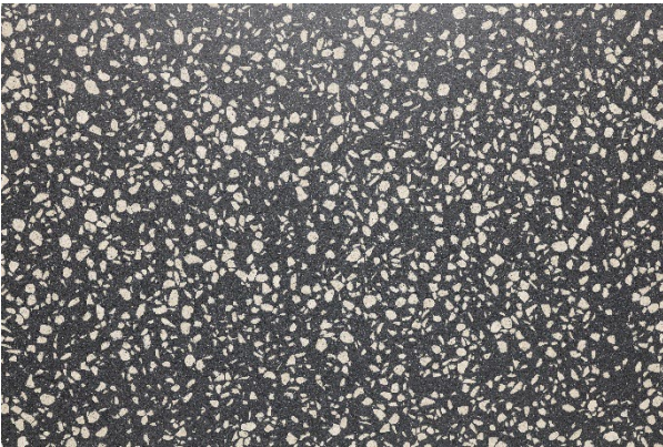
Alpinova terra notte