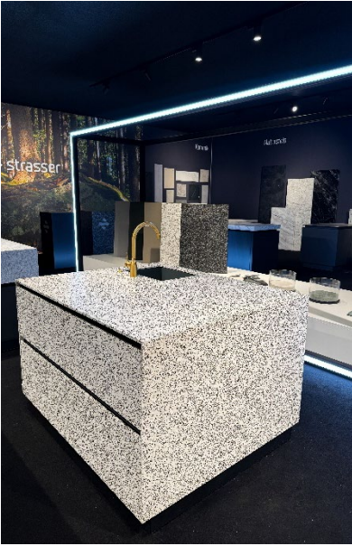
Alpinova cubo terra luna auf der area30 2025

STRASSER Steine ist mit einem Marktanteil von rund 65 Prozent der österreichische Marktführer im Bereich hochwertiger Küchenarbeitsplatten (Naturstein, Alpinova, Keramik) sowie der größte Produzent in Mitteleuropa. Mit Niederlassungen in St. Martin im Mühlkreis sowie in Kösching, Deutschland, ist das Unternehmen sowohl in Österreich als auch in Deutschland flächendeckend vertreten. Der internationale Vertrieb erfolgt über den Küchen- und Möbelfachhandel.