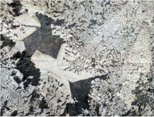
Naturstein Arctic Tiger