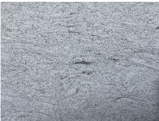
Naturstein Edelweiß