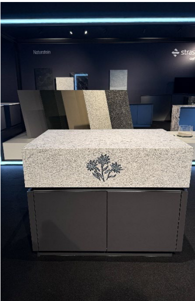
Naturstein Edelweiß auf der area30 2025