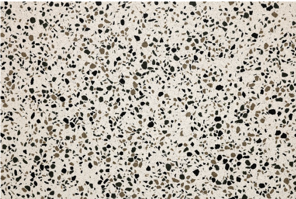
Alpinova terra luna